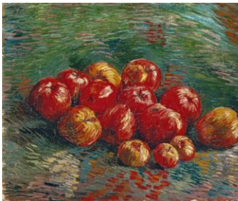
Vincent van Gogh

Der Apfel in der Kunst: Der Apfel ist ein sehr verbreitetes Motiv bildender Künstler.