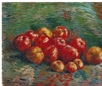
Vincent van Gogh

Jabolko v umetnosti: Jabolko je zelo pogost motiv likovnih umetnikov.