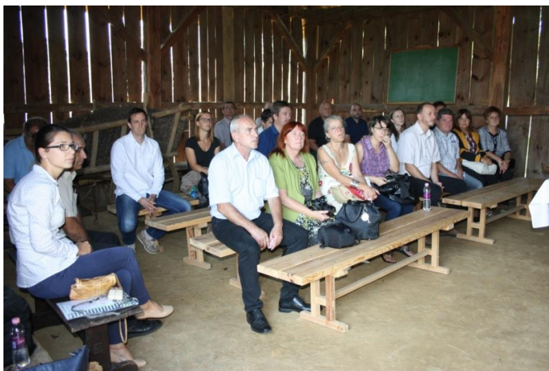
A rendezvény résztvevői