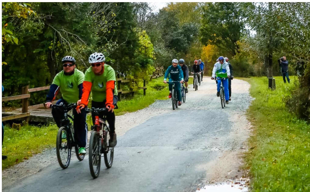
Államelnökök felvezetése az Őrségi Nemzeti Park Igazgatóság munkatársaival

2016. október 5-én Áder János magyar és Borut Pahor szlovén köztársasági elnök nem hivatalos, baráti látogatás keretén belül a Green Exercise projekt területén, az Őrségben és a Goričkóban tett közös kerékpártúrát. Az Orfalutól Szalafőig tartó út egyik, államfők által deklarált célja volt a kerékpározás népszerűsítése. A nagy médiaérdeklődést kiváltó eseményen az Őrségi Nemzeti Park Igazgatóság kerékpáros kíséretet biztosító munkatársai a projektet feliratos pólóban népszerűsítették.