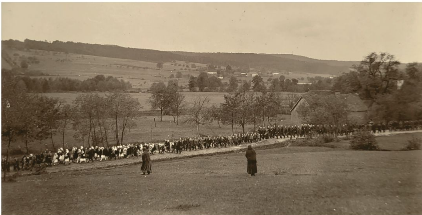
Julij Schönauer, Žalni sprevod po vasi ob smrti kralja Aleksandra, Šalovci 18. 10. 1934