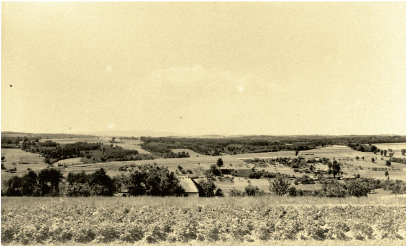
Pogled od Pečarovcev proti severozahodu, 1931