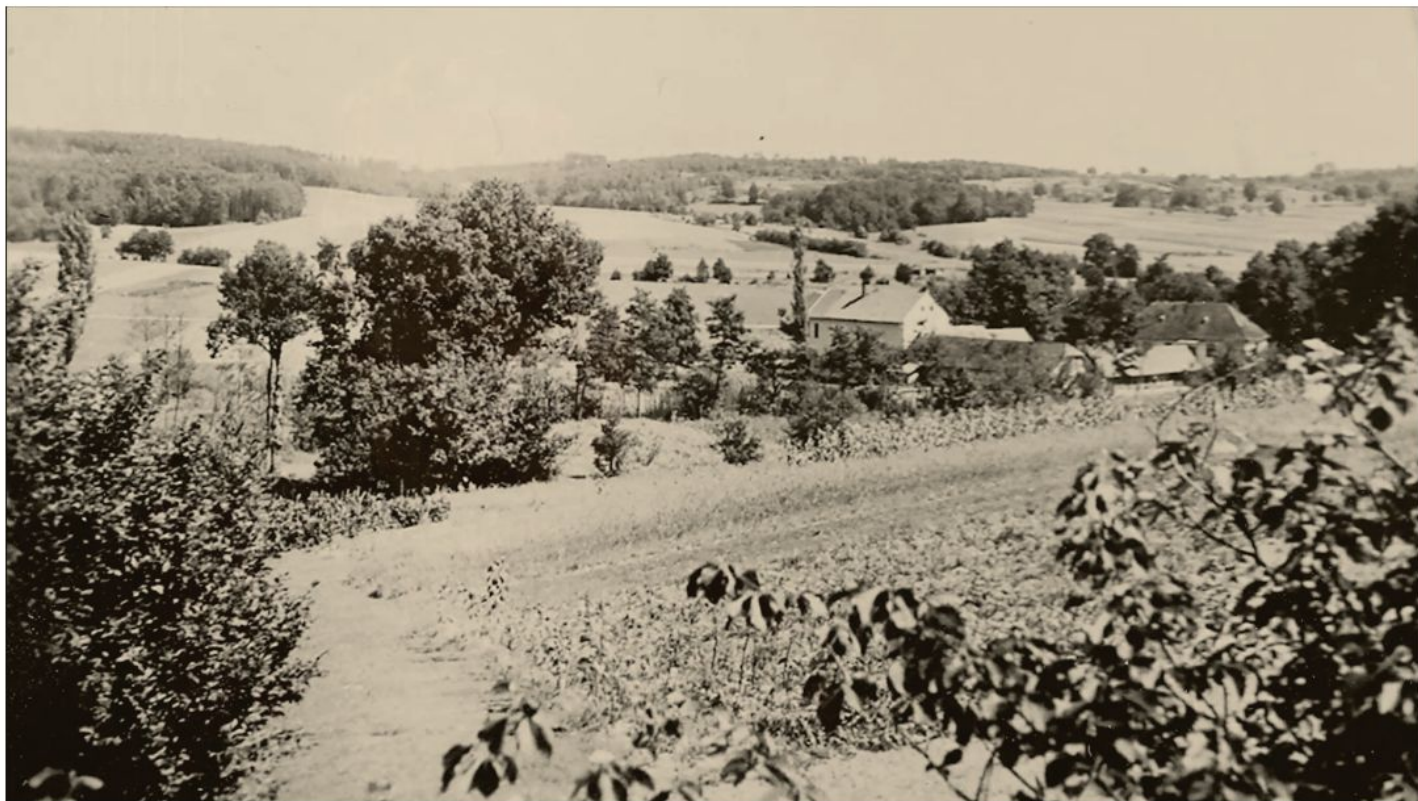
Prosenjakovci v prvi polovici 20. stoletja