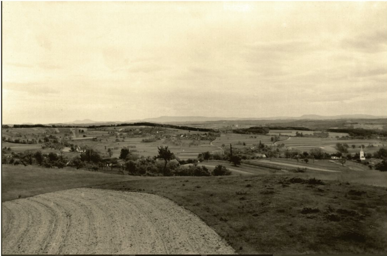
Pogled s Kameneka proti severozahodu, 1938