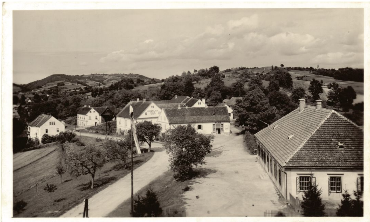
Sveti Jurij in Rogašovci