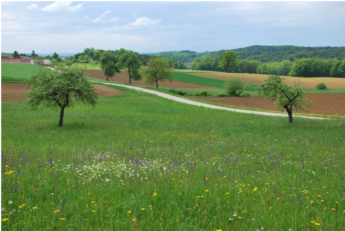
Slika 11: Na cvetočem travniku je včasih težko najti posamezne narcise

Travnik v k.o. Gerlinci, s parc.št. 1223, 1224 ; v katastru sem ugotovil, da je parcela 1223 sadovnjak, čeprav v naravi na parceli ni nobenih dreves. Na tej parceli sem preštel večino od 114 cvetočih rastlin narcis. Večinoma so se pojavljale posamič. Na parceli št. 1224, ki je v katastru njiva v naravi pa travnik je bilo le nekaj cvetočih narcis. Zanimivo bi bilo ugotoviti, do kdaj je bila v naravi njiva.