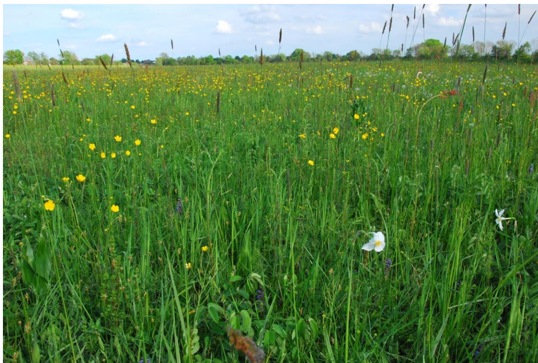
Slika 2: Narcisni travnik ob Kučnici na Evropski zeleni vezi