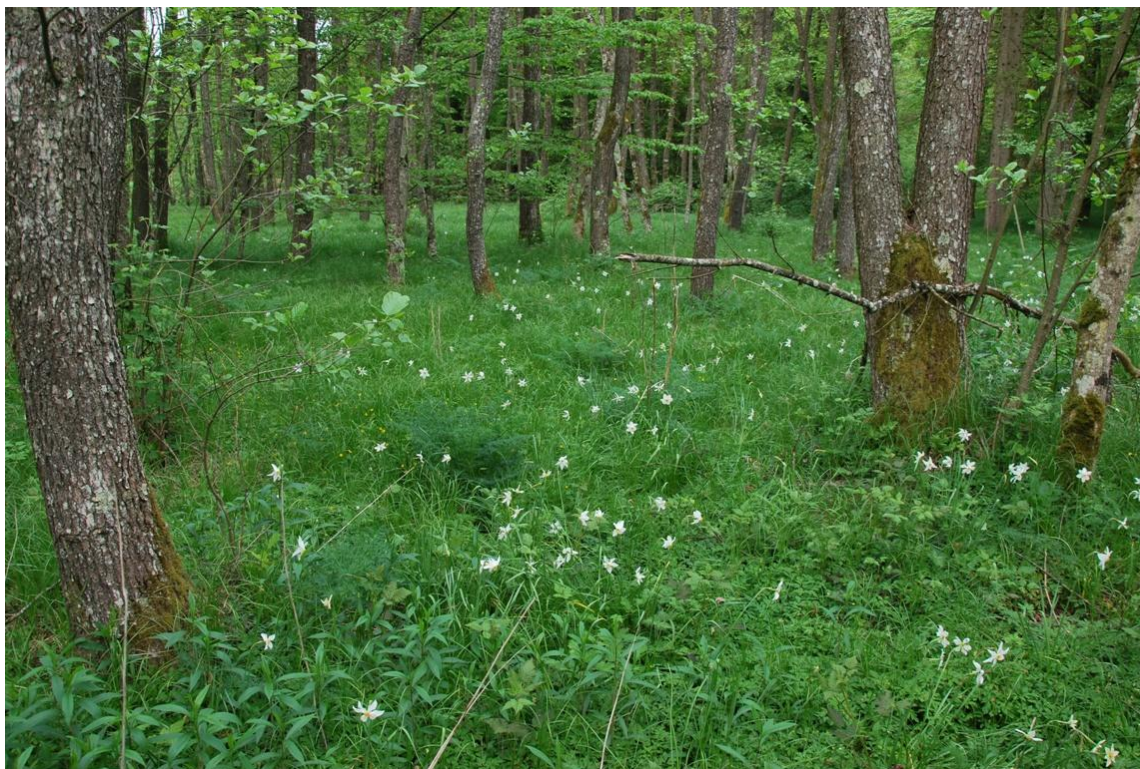
Slika 10: Narcise so v gozdu črne jelše našle primerne življenjske pogoje za rast oz so se nekdanji travniki zarasli s črno jelšo