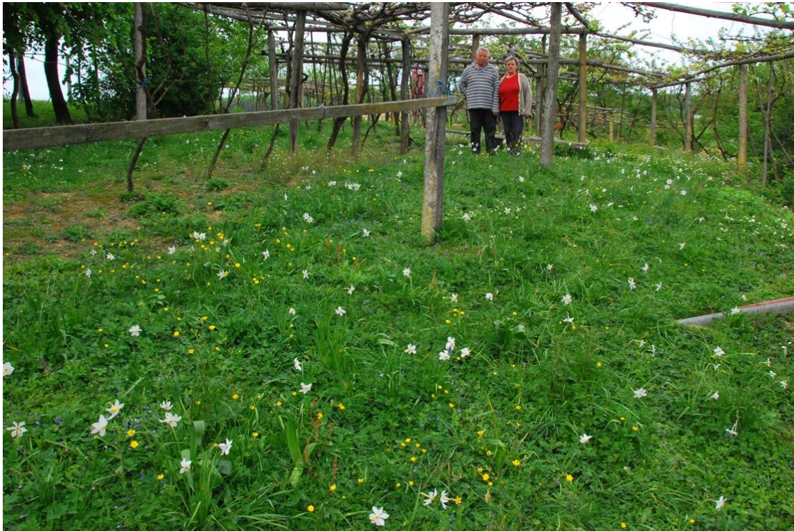
Slika 8: Ponosni lastniki narcis v Korovcih