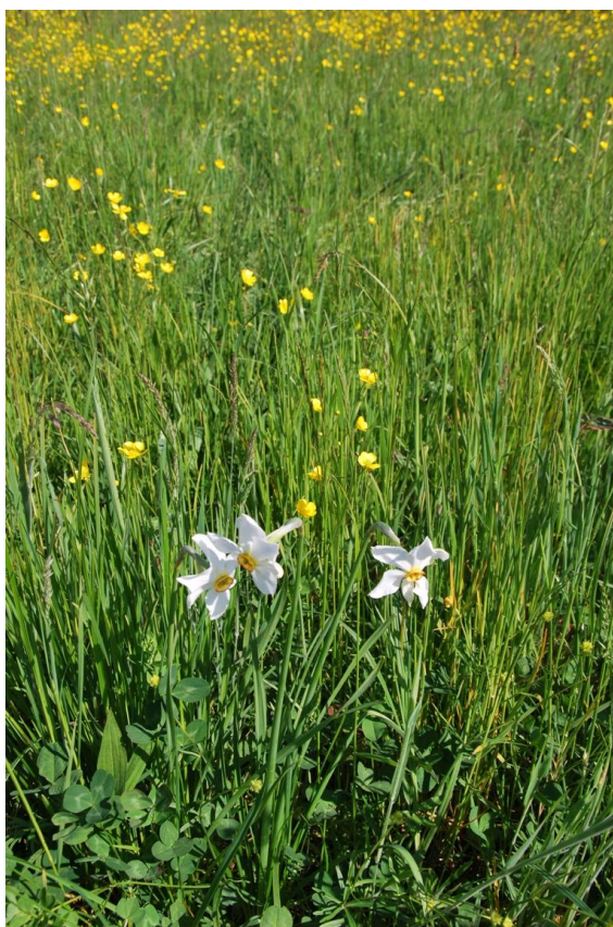
Slika 1: Tipična podoba enega izmed narcisnih travnikov v k.o. Korovci