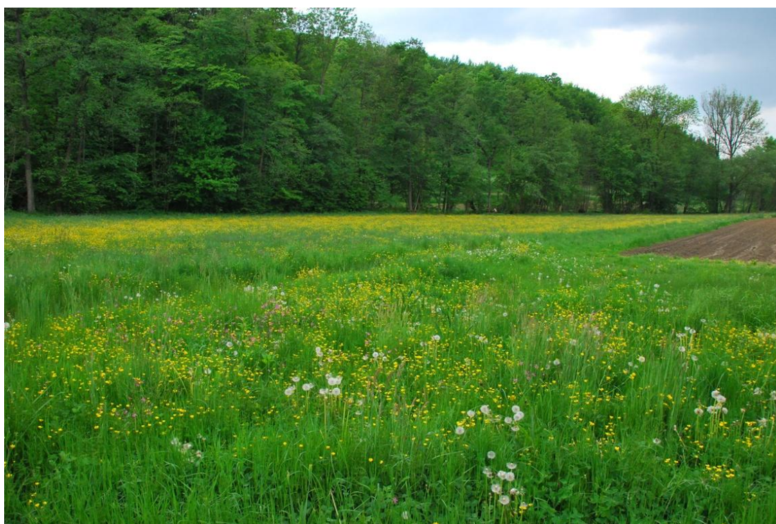
Slika 15: Travniki v Večeslavcih, kjer že dve leti zapored nisem našel nobene narcise