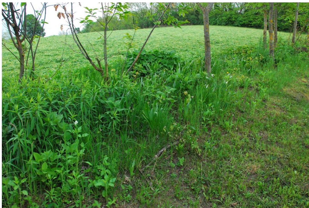
Slika 14: V bližini hiš, kjer travnate površine kosijo zelo pogosto, so se narcise »umaknile« na robove parcel