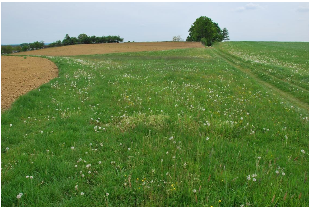
Slika 7: Gnojeni narcisni travniki z regratom