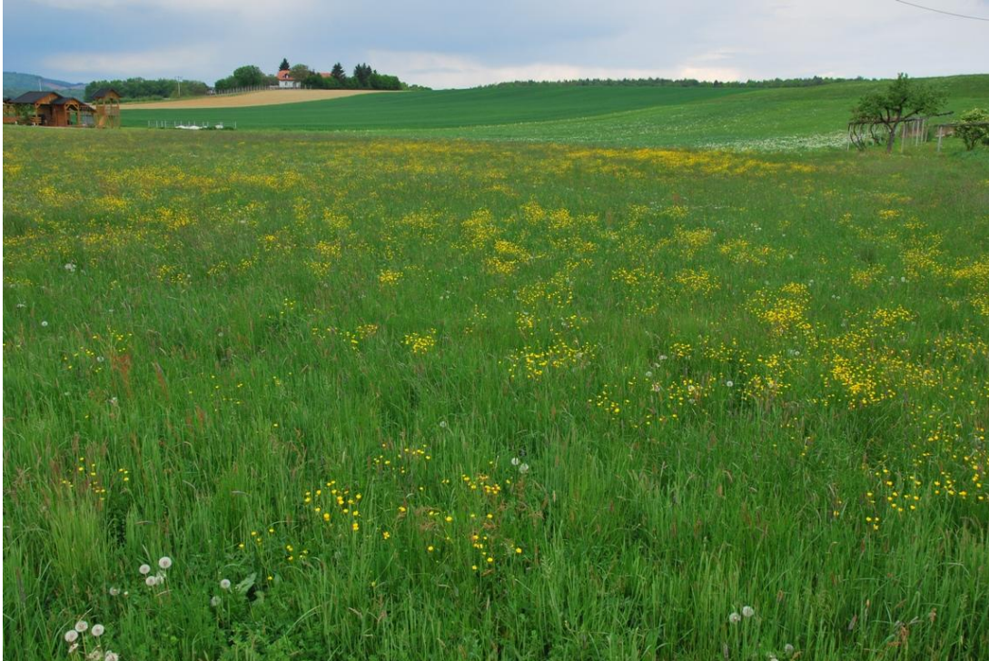
Slika 6: Gnojeni travniki s posameznimi narcisami v k.o. Korovci