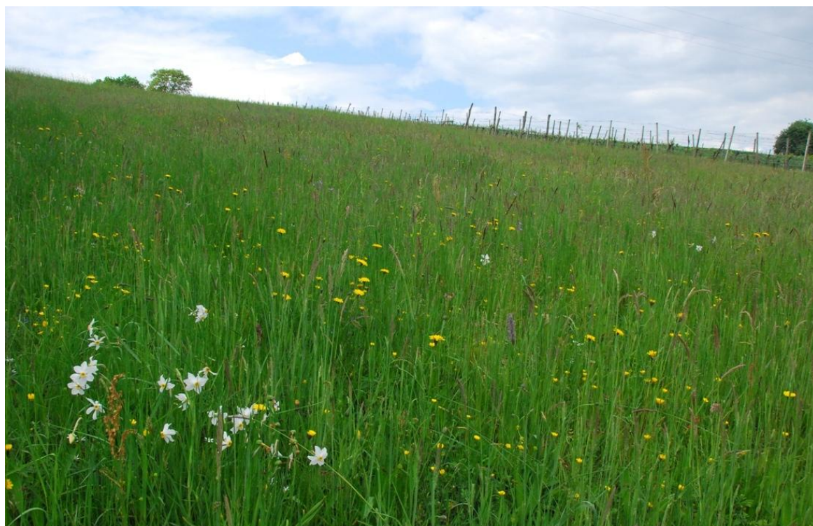
Slika 13: Narcise v Gerlincih na nekdanji njivi