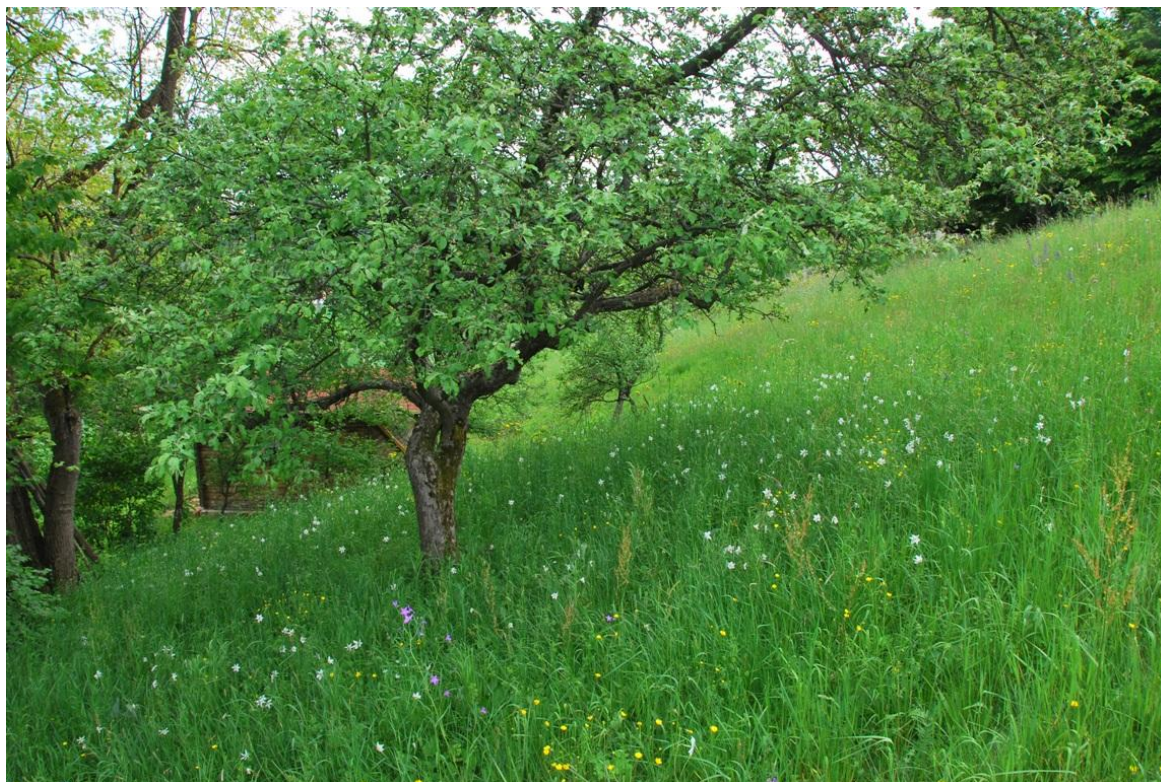
Slika 12: Narcise v visokodebelnem sadovnjaku so se ohranile verjetno zato, ker v njih niso gnojili