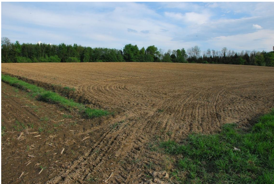
Slika 4: Nekdanji narcisni travnik v k.o. Korovci preoran v njivo