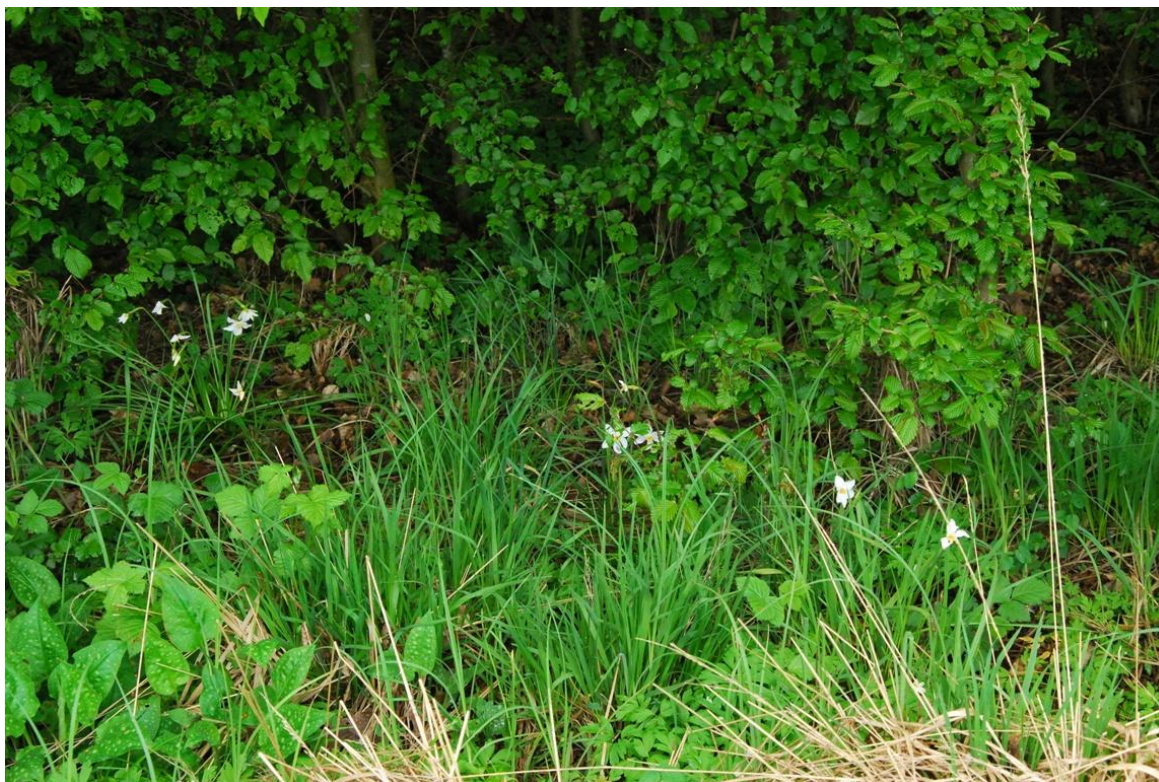
Slika 5: Na gnojenem travniku narcise najdemo pretežno na zunanjih robovih oz na gozdnem robu, kot je bil primer travnika v k.o. Gerlincih