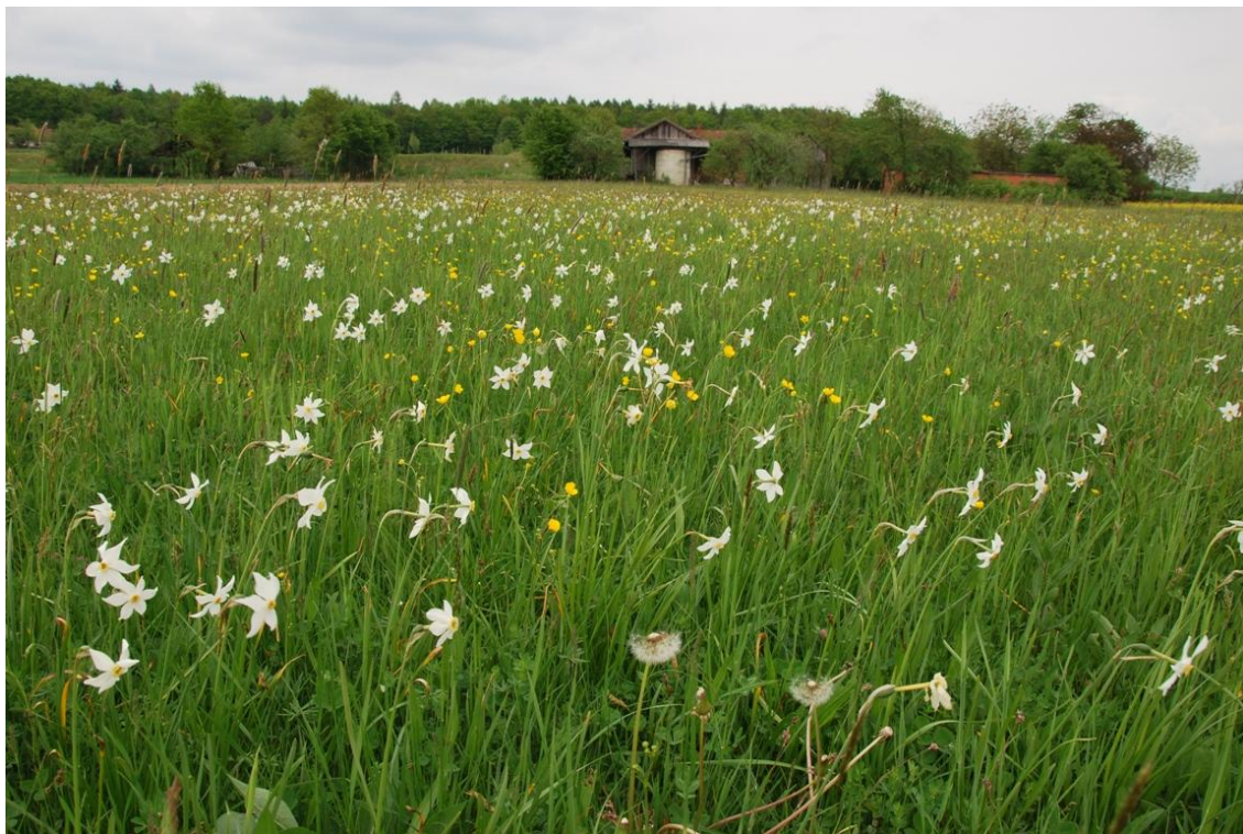
Slika 9: Ekstenzivni narcisni travnik v k.o. Korovci na Evropski zeleni vezi