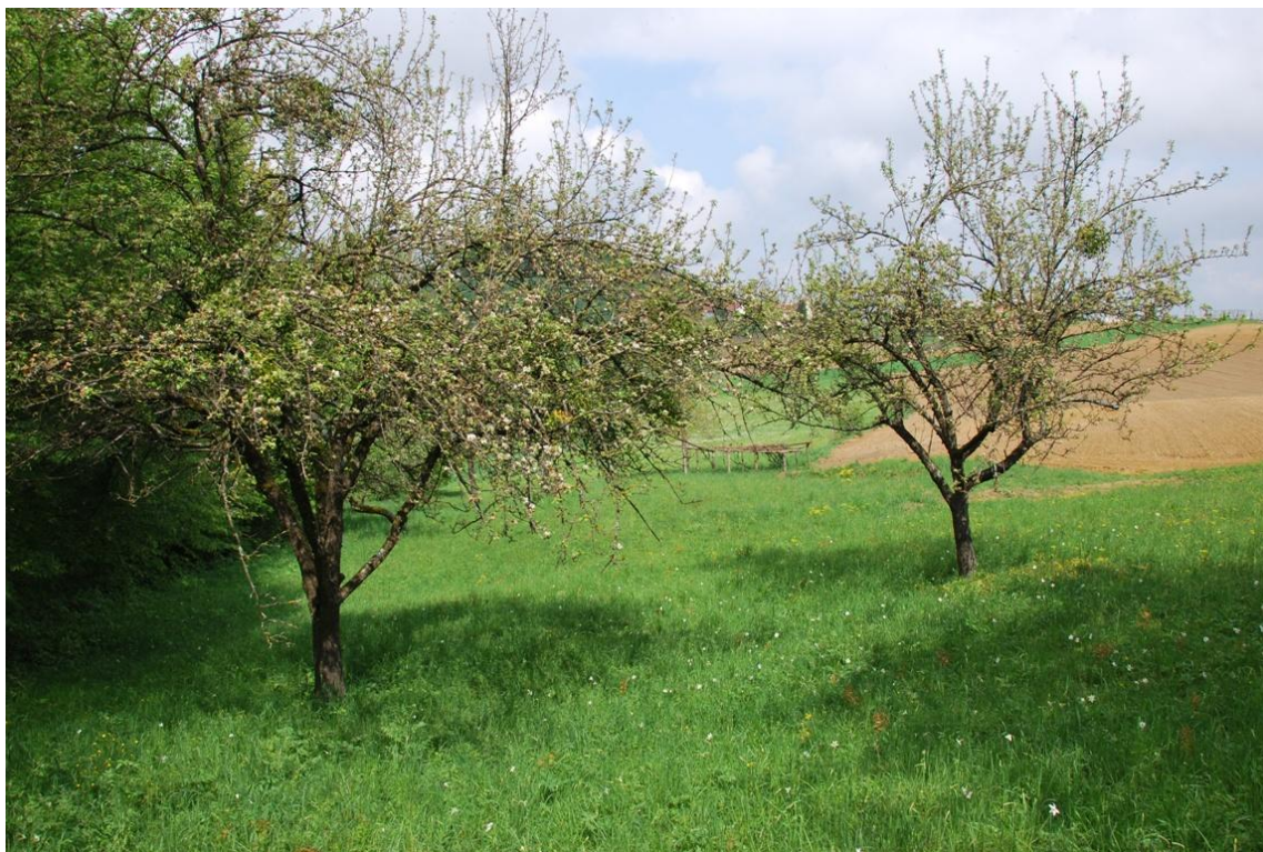
Slika 3: Narcisni travnik v k.o. Pertoča, ki se je v zadnjih letih že začel zaraščati z nepravo robinijo, zdaj zopet redno kosijo