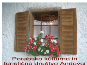
Porabsko kulturno in turistično društvo Andovci

ali po e-pošti: zido.vendel@gmail.com in pred začetkom pohoda